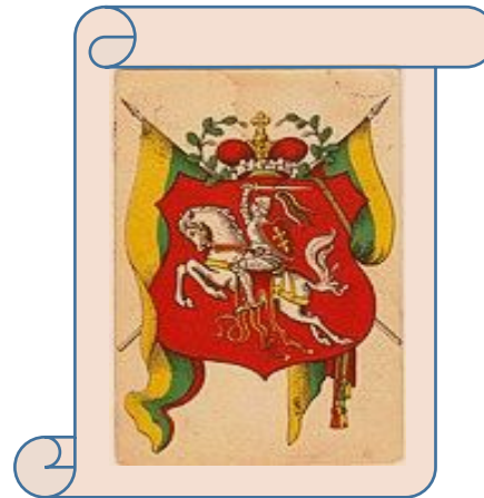
Staatswappen der Republik Litauen von 1921