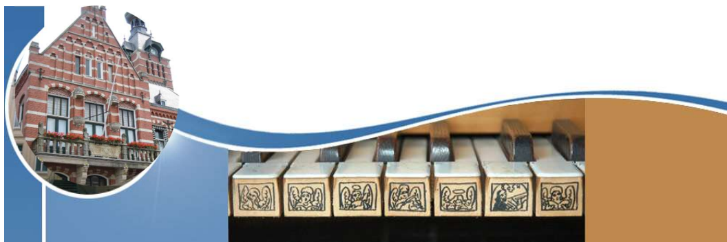
Rathaus in Winschoten und Orgel-Manual

Abendessen im Restaurant des Hotels Corps de Garde, Übernachtung im Hotel Halbert, Groningen