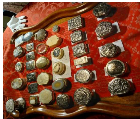
Silberdosen des 18. und 19. Jahrhunderts, Privatsammlung, Friedrichstadt