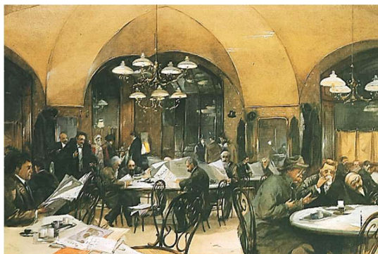
Reinhold Völkel „Café Griensteidl“ (1896)